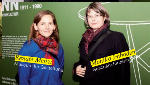
Renate Menzi Museum für Gestaltung