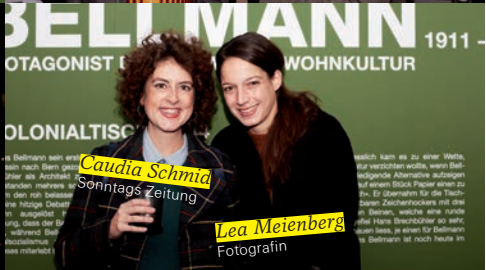
Caudia Schmid Sonntags Zeitung