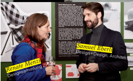
Renate Menzi Designsammlung ZHdK